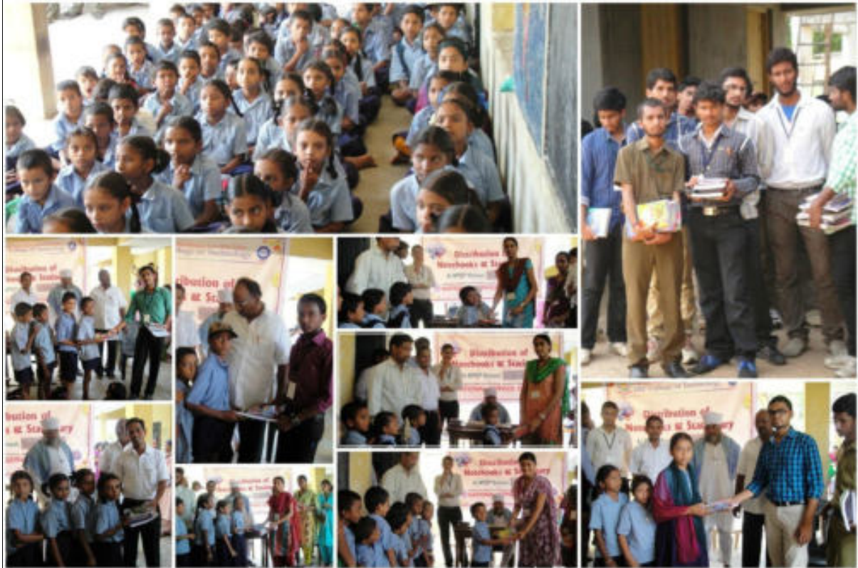
Distribution of note books at MPP Urdu School Pendyala