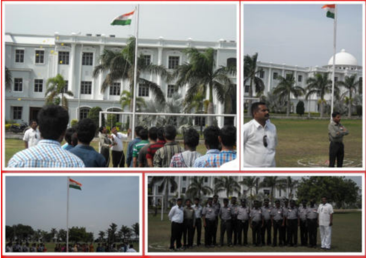
INDEPENDENCE DAY CELEBRATIONS