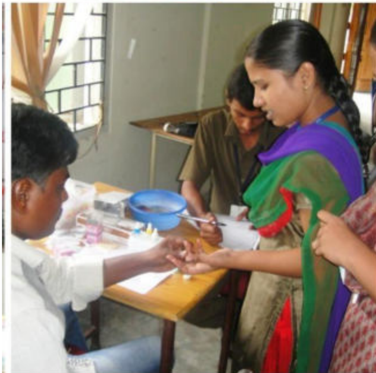
BLOOD GROUPING AT CAMPUS