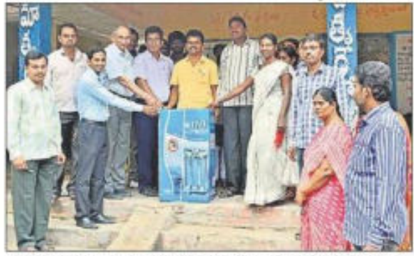
నీటిశుద్ధి యంత్రాన్ని అందిస్తున్న మిక్ విద్యార్థులు, యాజమాన్యం