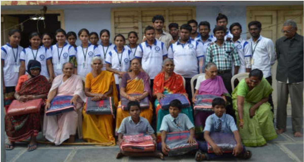
NSS volunteers with old aged at Sai Netra Oldage Home, Kanchikacherla