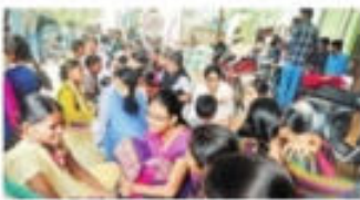
అనాథ బాలలకు మిక్ ఇంజనీరింగ్ విద్యార్థుల సాయం

కంచికచర్ల: స్థానిక మిక్ ఇంజనీరింగ్ కళాశాల ఎస్ఎస్ఎస్ విద్యార్థులు విద్యార్థుల సాయం కోసం అనాథ బాలలకు సహాయం చేస్తున్నారు. ఈ సందర్భంగా అనాథ బాలలకు సహాయం చేస్తున్నారు. అనాథ బాలలకు సహాయం చేస్తున్నారు. అనాథ బాలలకు సహాయం చేస్తున్నారు.