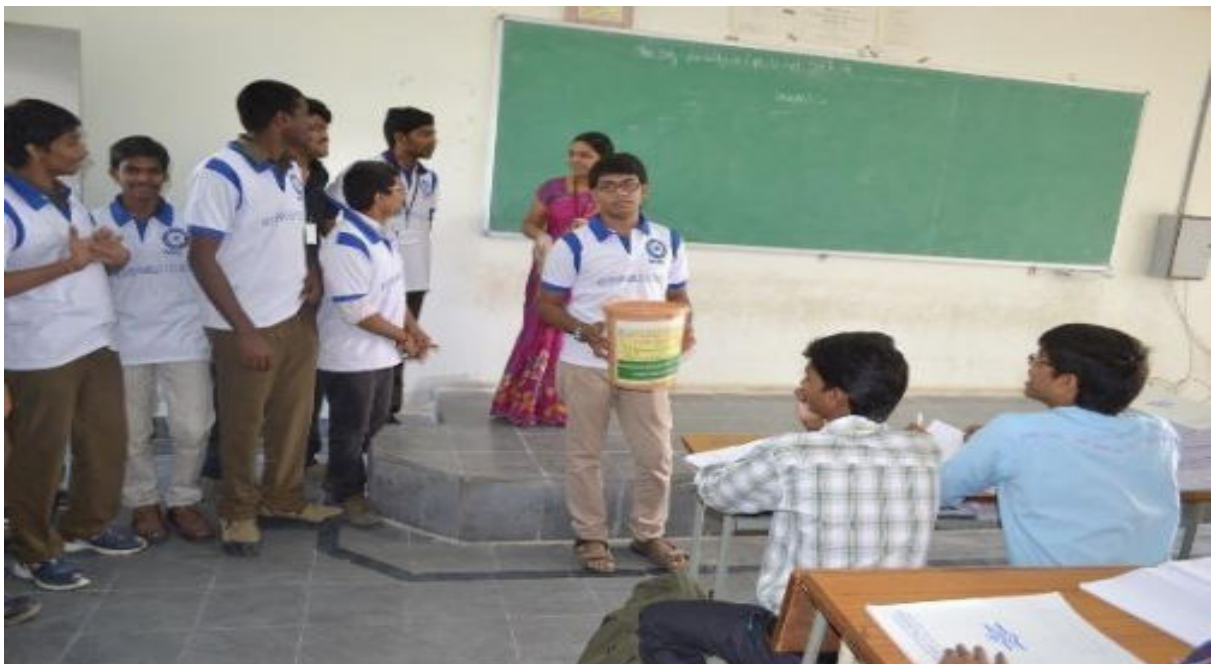
SWATCHH BHARAT MISSION-CAMPUS CLEAN AND GREEN