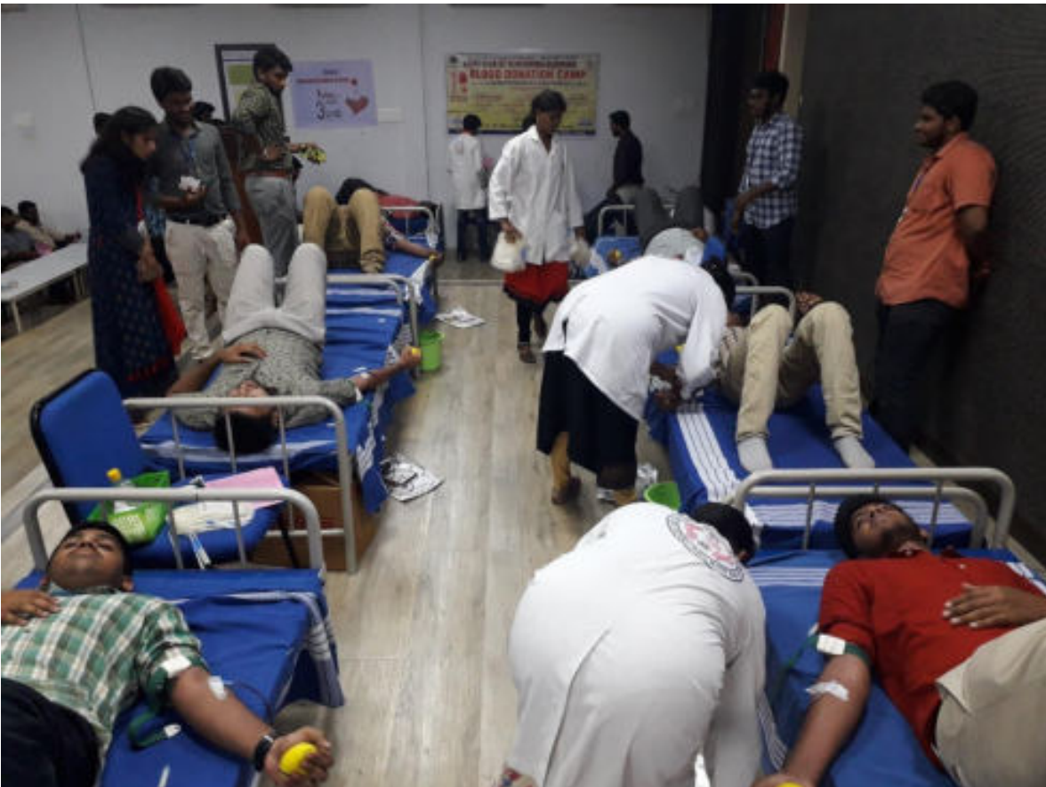
Students Donating the blood during the camp