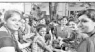
అనాథ పిల్లలకు తోడుగా విద్యార్థులు

కంచికచర్ల: స్థానిక మిక్ ఇంజనీరింగ్ కళాశాల ఎస్ఎస్ఎస్ విద్యార్థులు అనాథ బాలలకు సహాయం చేస్తున్నారు. అనాథ బాలలకు సహాయం చేస్తున్నారు. అనాథ బాలలకు సహాయం చేస్తున్నారు.