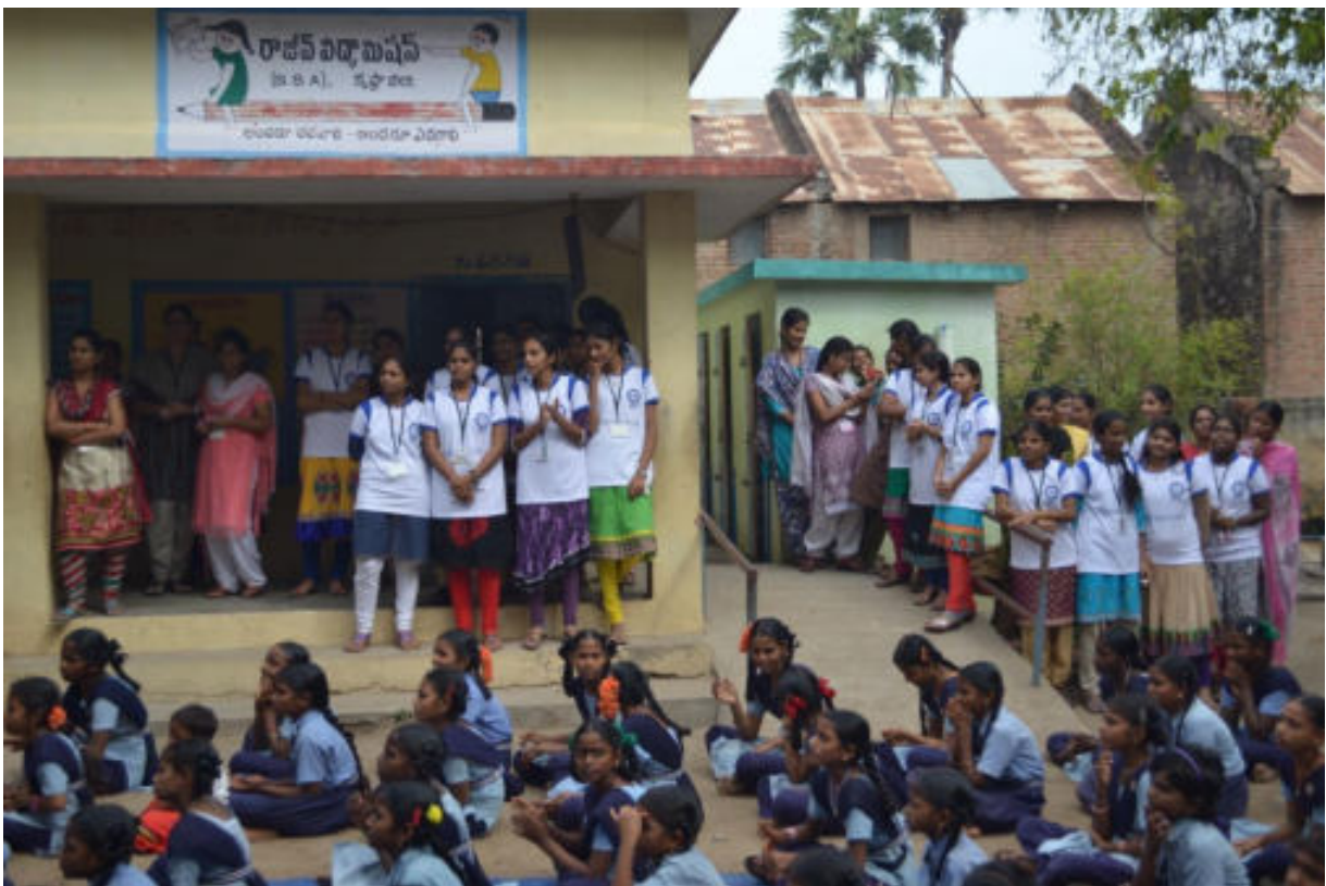
Volunteers and school children during the event at MPUP School, Perakalapadu.