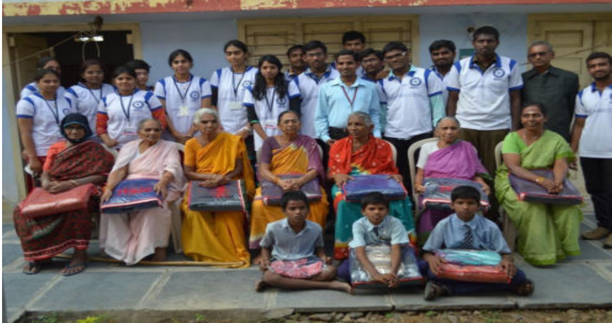
VISIT TO OLDAGE HOME & SWACHH BHARAT ATOLDAGE HOME